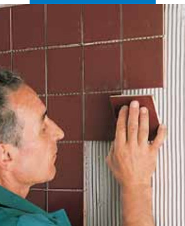
Posa su intonaco in gesso