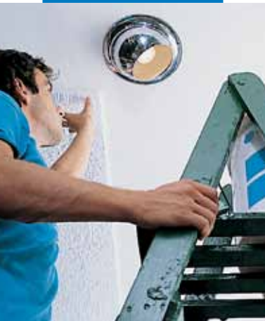
Posa di soffitto in polistirolo espanso