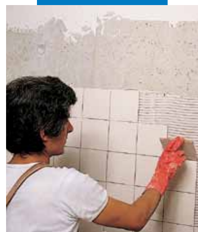
Posa su pareti in calcestruzzo