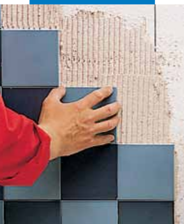
Posa su polistirolo espanso