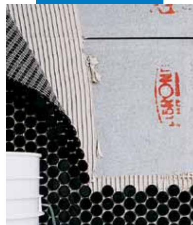
Posa di mosaico su fibrocemento