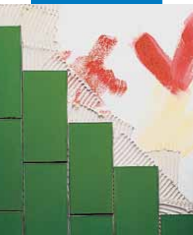
Posa su pareti verniciate