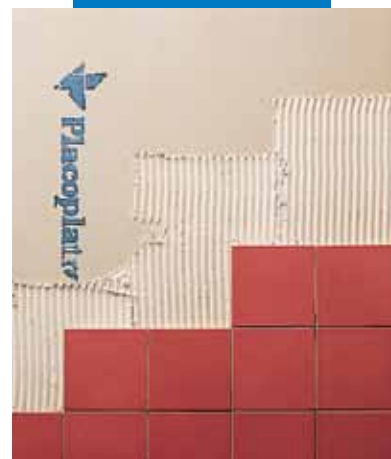
Posa su gesso cartonato