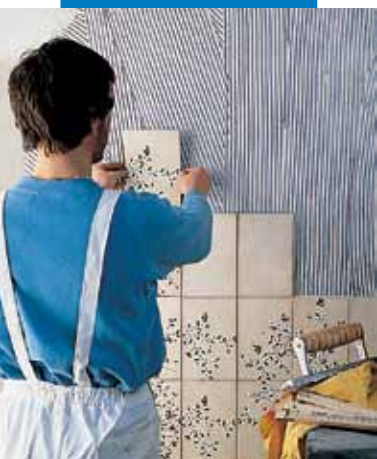
Posa su intonaco normale